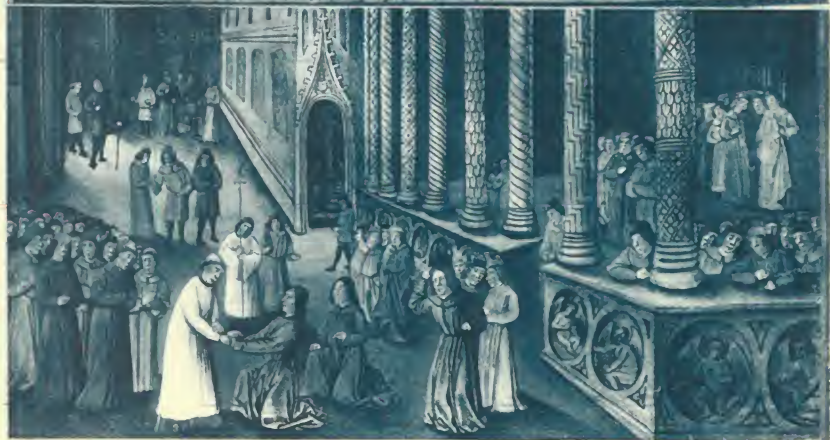
COMMENT LES CROISÉS ARRIVÈRENT DEVANT DAMAS ET COMMENT GODEFROY FUT CONFIRMÉ ROI DE JÉRUSALEM